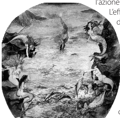
Il mito di Colapesce interpretato da Renato Guttuso e affrescato nella volta del Teatro Vittorio Emanuele II di Messina

Ammaliato dalle sue capacità e in cerca di un giovane sposo per la principessa sua figlia, il re sottopone Colapesce a prove atte a verificarne le capacità. Durante le prove, poiché incaricato espressamente di esplorare cosa c'è sotto Messina, Colapesce fa una strabiliante scoperta: la città è in pericolo in quanto retta da tre colonne, di cui una soltanto è sana. Delle altre due, una è rotta, l'altra è scheggiata. Vinto dal senso del dovere verso la sua città Colapesce decide di inabissarsi per non tornare mai più in superficie, nell'intento di porre riparo alla situazione drammatica scoperta in profondità. Inutile dire che questo mito da secoli aleggia sui messinesi come un monito riguardo al rischio sismico a cui l'area è sottoposta. Non a caso la sua centralità nella cultura popolare messinese è onorata nella volta del Teatro Vittorio Emanuele II da un'opera del pittore Renato Guttuso che ne illustra in modo fiabesco l'azione chiave: Colapesce intento a tuffarsi in mare.