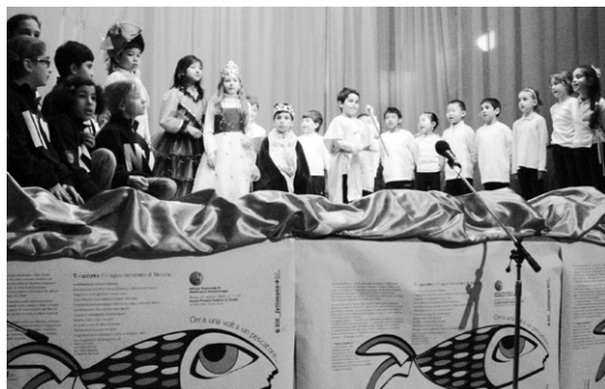
Una delle scene finali della rappresentazione; sulla sinistra si intravedono i bambini-sismologi che indossano la felpa INGV

Gli insegnanti della quarta classe hanno sottolineato come, attraverso il coinvolgimento nell'esperienza teatrale, gli alunni abbiano rafforzato e approfondito le conoscenze sul terremoto. Inoltre i docenti hanno trovato molto utili le tecniche di drammatizzazione, sia da un punto di vista didattico che da un punto di vista relazionale. La drammatizzazione ha consentito inoltre di integrare meglio nel gruppo classe i bambini diversamente abili. Se teniamo conto che la valutazione ha messo in evidenza una insufficienza per quanto riguarda l'efficacia formativa del progetto rispetto agli obiettivi di riduzione del rischio sismico, dobbiamo concludere che anche presso gli insegnanti sia poco conosciuto il concetto di prevenzione del rischio.